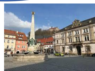
Château médiéval dominant la ville – Mairie de Kulmbach – une des places de la ville